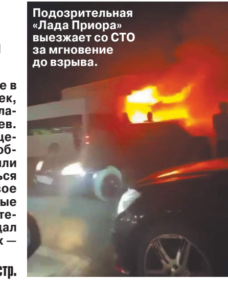
Подозрительная «Лада Приора» выезжала со СТО за мгновение до взрыва.