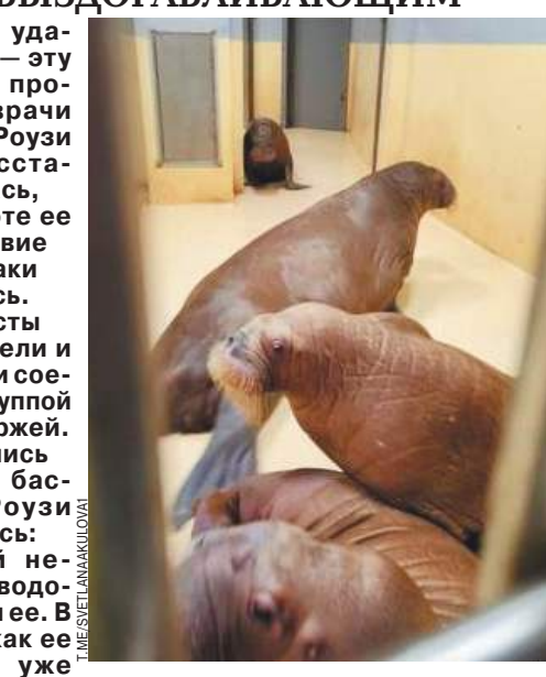
Морж Роузи в Московском зоопарке.

Окровавленный морж в Московском зоопарке вызвал настоящую панику среди посетителей. Администрация зоопарка сообщила, что с морским гигантом не произошло ничего плохого. Специалисты перенесли непростую операцию по удалению клыка: сейчас она впервые за долгое время чувствует себя хорошо и наконец воссоединилась с сородичами. Как узнал «МК», на днях посетители главного зоопарка страны заметили, что один из моржей находится во восторженном состоянии. Гости испугались, что животное страдая и нуждается в срочной помощи. В зоопарке пояснили, что речь идет о моржике Роузи, которая приехала на Пресню из Москвариума. Питомце