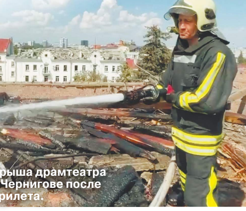
Крыша драмтеатра в Чернигове после прилета.