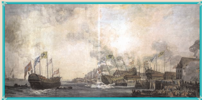
Спуск трехдечного корабля в Дептфорде 2-я половина XVIII в.

Письмо адмирала С.К. Грейга графу И.Г. Чернышеву о получении чертежа «Victory»