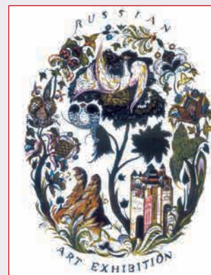
▲ Композиция на обложке каталога «The Russian Art Exhibition. Grand Central Place». New York, 1924