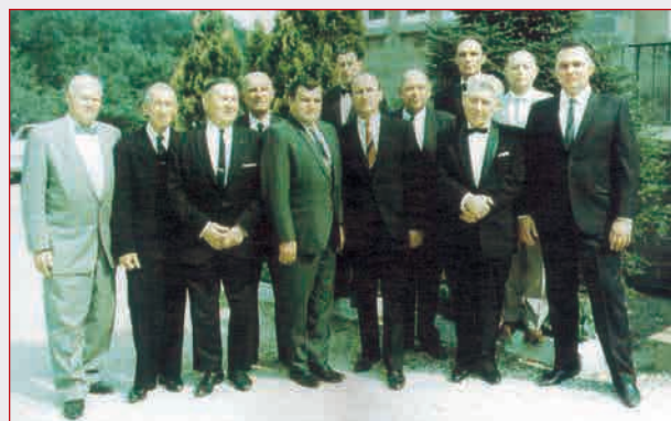
Совет старшин 1960 г.