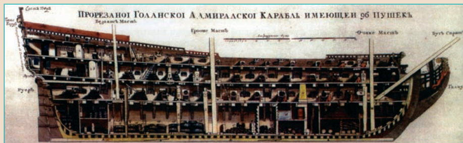
Продольный разрез 96-пушечного корабля начала XVIII в. Из книги «Новое Голландское кораблестроение...» 1709 г.