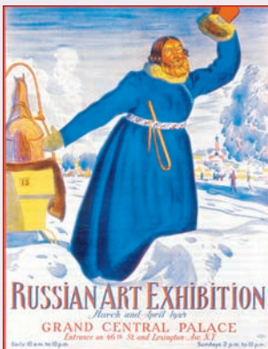
▲ Афиша выставки русского искусства в Нью-Йорке, выполненная по мотивам картины Б.М. Кустодиева «Извозчик»

Художник Ф.И. ЗАХАРОВ, Нью-Йорк, 1924 г.