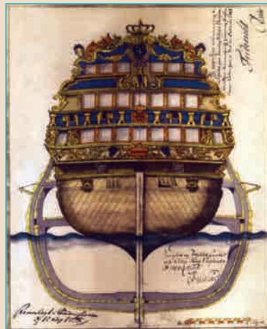
Корма и мидель датского трехдечного корабля «Elephanten» Начало XVIII в.