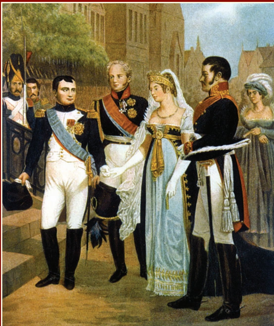
Прием Наполеоном королевы Прусской Луизы в Тильзите в 1807 г.