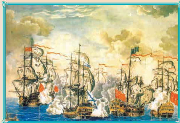
Сражение у мыса Калиакрия 31 июля 1791 г. Художник А. ДЕПАЛЬДО