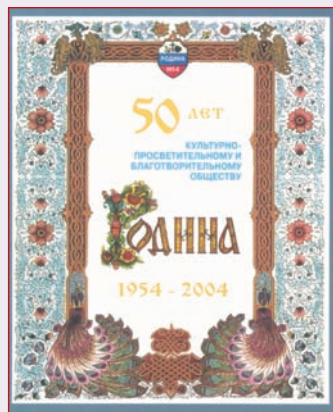
▲ Обложка книги