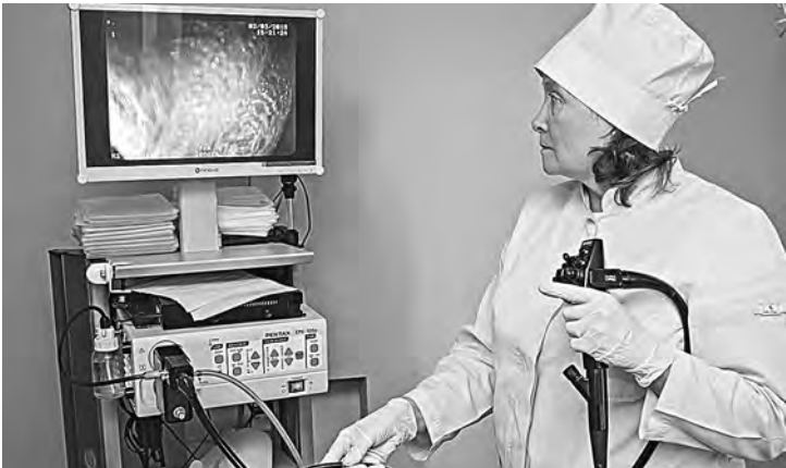
Важнейшее место в ранней диагностике рака отводится специалистам первичного звена.