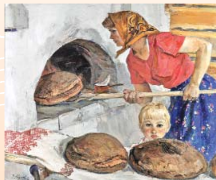
Э. Козлов. Выпечка хлеба. 1967