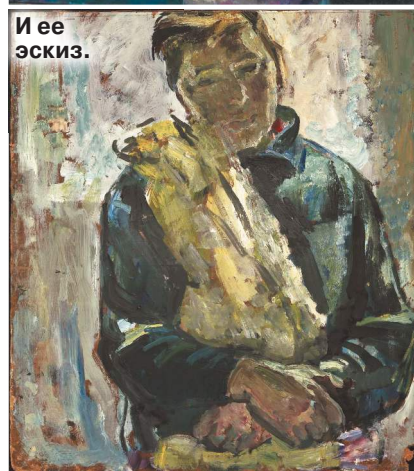
И ее эскизы.