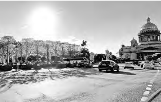
Временный сад расположился недалеко от Исаакия.

В Петербурге в день рождения города открыли сад на Исаакиевской площади напротив Мариинского дворца. Сад открылся на месте парковки Законодательного собрания. Деревья, в основном липы, их в саду 104, выставили в кадках на асфальт. Половина деревьев подстрижены в виде куба, остальные — в виде шара. Деревья и кустарники будут находиться в саду до сентября, а затем их пересадят вдоль набережных рек и каналов города. Общая стоимость сада составляет рекордные 162 миллиона рублей.