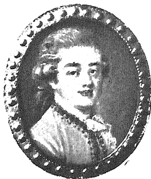
(Галль?) Портретъ Невѣстнаго. (Hall?) Portrait d'un inconnu.