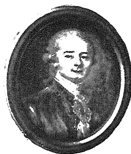
Портретъ Невѣстнаго. Portrait d'un inconnu.