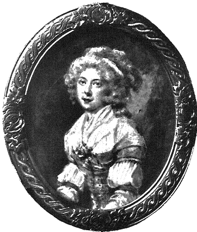
Риттъ.—Женскій портретъ. Ritt.—Portrait de femme.