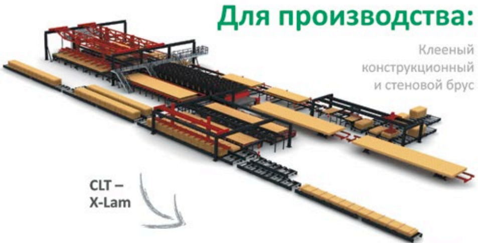
CLT – X-Lam

ОТРАСЛЕВЫЕ МЕРОПРИЯТИЯ ..... 166 INDUSTRY EVENTS РЕКЛАМА В ЖУРНАЛЕ ..... 168 ADVERTISEMENT IN THE ISSUE