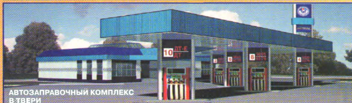
АВТОЗАПРАВОЧНЫЙ КОМПЛЕКС В ТВЕРИ