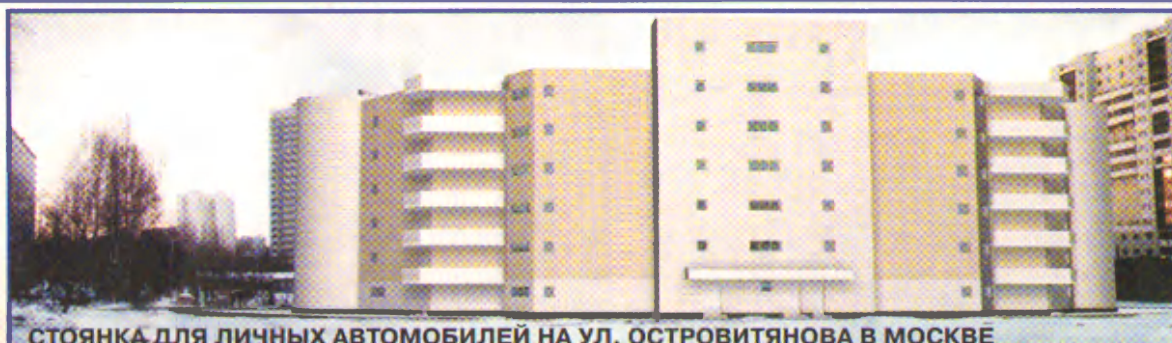
СТОЯНКА ДЛЯ ЛИЧНЫХ АВТОМОБИЛЕЙ НА УЛ. ОСТРОВИТЯНОВА В МОСКВЕ