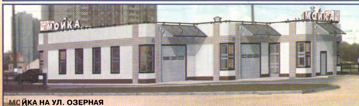
МОЙКА НА УЛ. ОЗЕРНАЯ