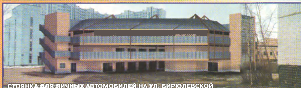
СТОЯНКА ДЛЯ ЛИЧНЫХ АВТОМОБИЛЕЙ НА УЛ. БИРЮЛЕВСКОЙ