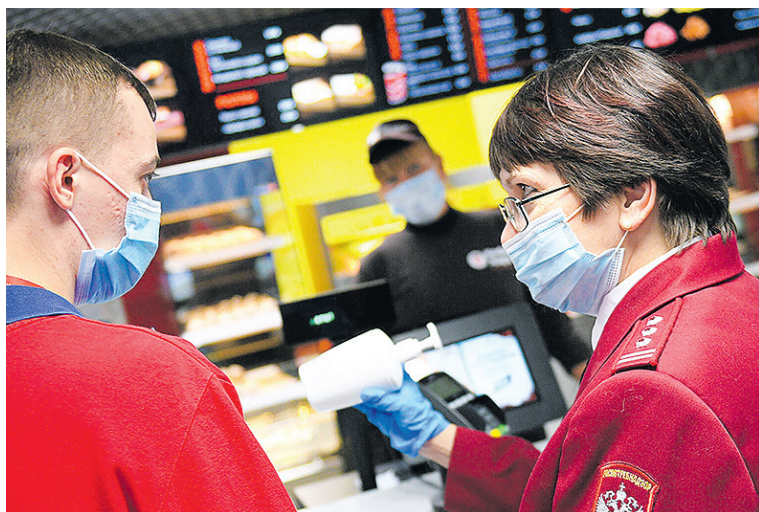
Санитарные правила не соблюдают в магазинах, общепите и на транспорте.

Но нарушения выявляют не только в сфере торговли. Так, в детском оздоровительном лагере «Комета» в Пермском районе сотрудники Роспотребнадзора об-