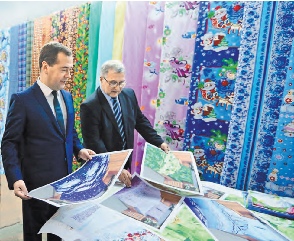
На ивановской текстильной фабрике Дмитрию Медведеву показали красивые натуральные ткани — ситец, бязь — готовую продукцию, а также образцы новых рисунков на будущих изделиях.

Дмитрий Медведев побывал на ивановской текстильной фабрике «Красная Талка», основанной еще в 1780 году, и провел совещание о развитии текстильной промышленности. Он напомнил, что отрасль долгие годы переживала спад, треть предприятий — убыточные, а ведь фабрики — градообразующие предприятия. Причины премьер видит в старении оборудования, зависимости от импорта сырья и, конечно, в жесткой конкуренции. Но спрос на текстиль будет, тем более в условиях нынешнего импортозамещения. Импорт текстиля в Россию уменьшается — за прошедшие месяцы на 6,5%, так что у текстильщиков есть хороший шанс преуспеть. Премьер пообещал, что правительство подготовит меры, которые помогут отрасли. Но в борьбу за покупателя должны активно включиться и производители. «Наши люди уже другие, — сказал премьер, — они хотят покупать современные товары, которые не уступают импортным по дизайну, по качеству». И напомнил: в условиях жесткой конкуренции выживают те, кто быстрее реагирует на требования рынка, осваивает новый ассортимент.