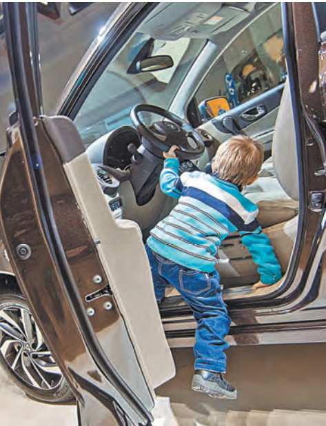
ПДД стали жестче — возможно, станет значительно меньше аварий и больше сохраненных жизней.

Вступило в силу постановление правительства о допуске к управлению транспортными средствами. Этот документ устанавливает критерии, по которым будут принимать экзамены в ГИБДД. Пожалуй, одно из главных новшеств — это возможность сдавать экзамен где угодно, то есть в любом подразделении ГИБДД без привязки к месту жительства. Отучился в Санкт-Петербурге, а сдать экзамен на права и получить водительское удостоверение можешь в Москве. Как с регистрацией автомобилей. Единственное исключение — иностранцы. Им придется сдавать по месту временной регистрации. Это связано с особенностями миграционного законодательства. Довольно сильно документ подпортил