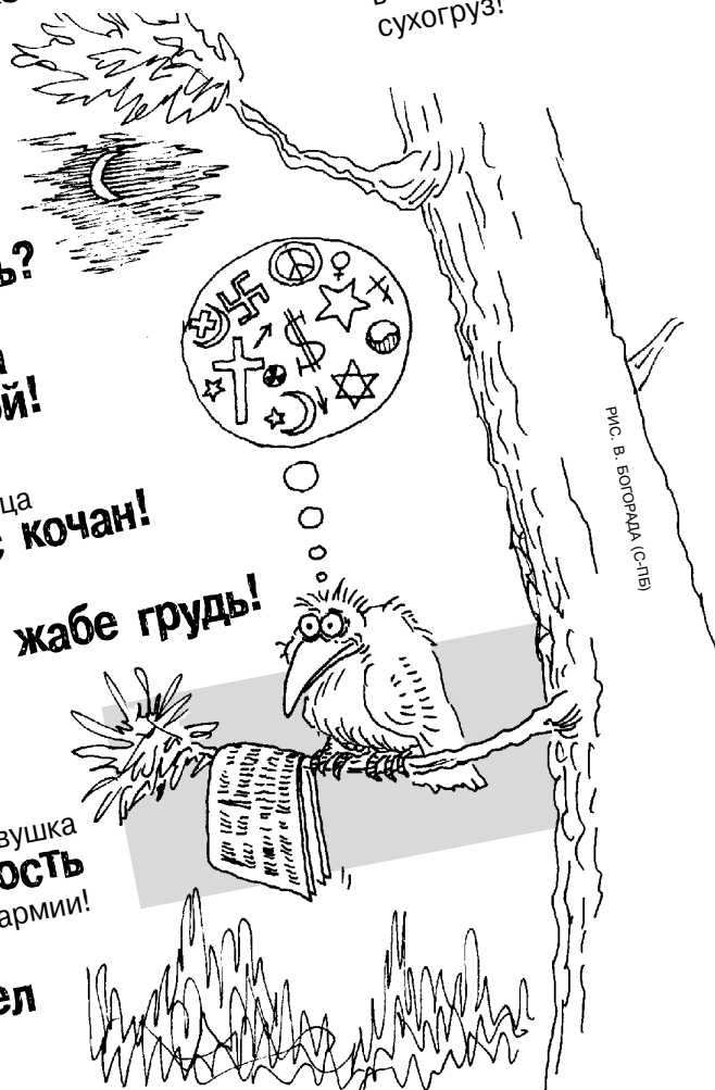
рис. В. Богорада (спб)

На дне Байкала обнаружен затонувший в Охотском море сухогруз!