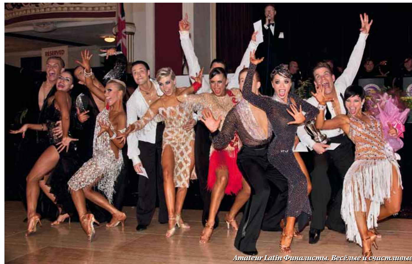
Amateur Latin Финалисты. Весёлые и счастливые