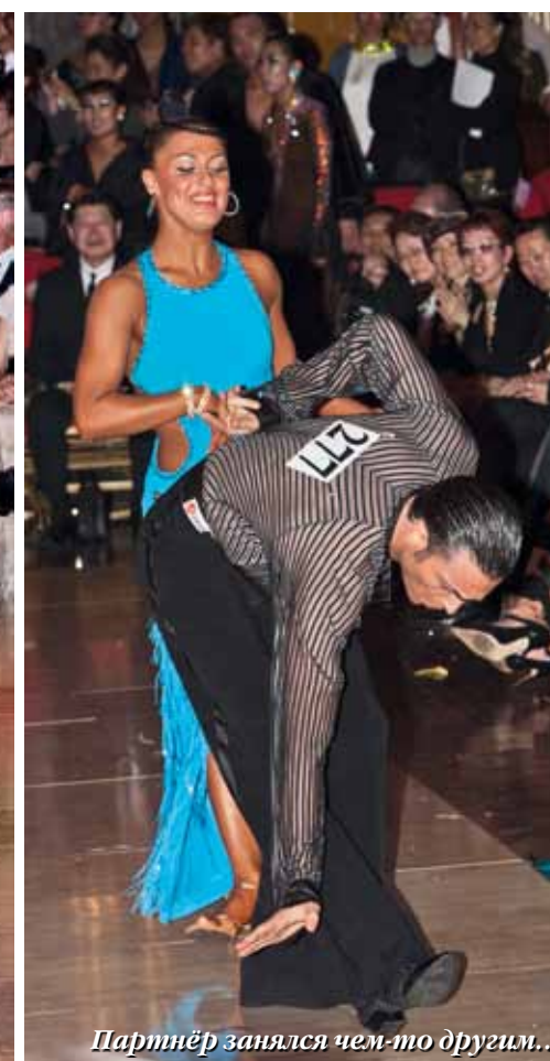
Партнёр занялся чем-то другим...