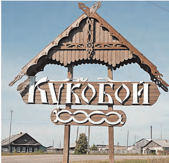
Запрятанное в глуши село бьет рекорды по количеству туристов.

Около 100 километров по федеральной трассе М-8 от Ярославля в сторону Вологды, еще 70 по латаной-перелатаной дороге от поселка Пречистое — и мы в Кукобое. Можно по М-8 проехать на 35 километров дальше — до деревни Заемье в Вологодской области, и свернуть налево там, тогда на «стиральную доску» придется всего около 25 километров. Но придется стоять у переезда на