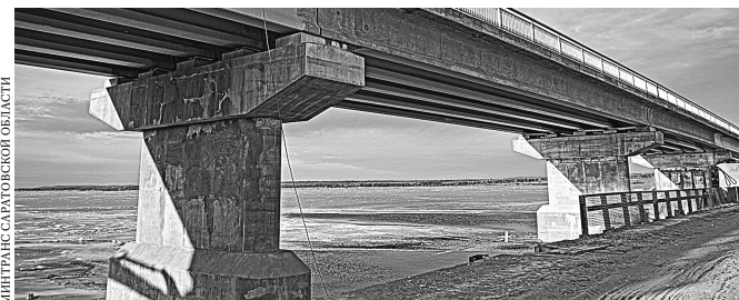
В 2023-м отремонтируют оставшиеся 28 километров дороги.