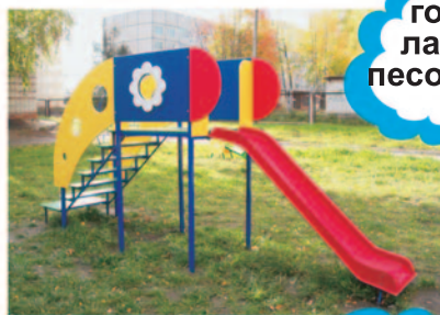
горки лазы песочницы