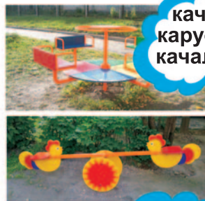
качели карусели качалки