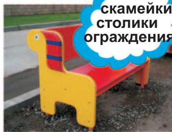
скамейки столики ограждения