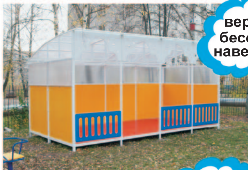
веранды беседки навесы