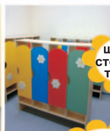
шкафы стеллажи тумбы