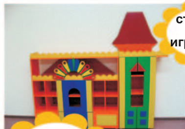
стенки для игрушек