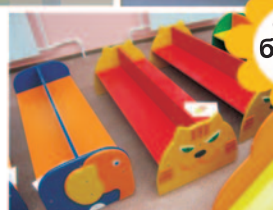
стулья банкетки столы