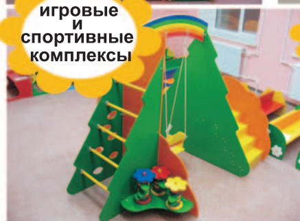
игровые и спортивные комплексы