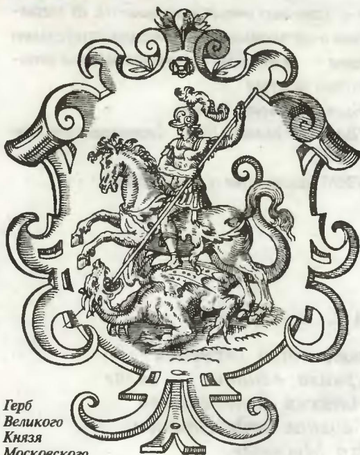
Герб Великого Князя Московского (с немецкой гравюры на дереве конца XVI столетия)