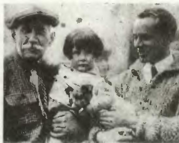
Амундсен и Нобиле на судне «Виктория» на обратном пути с Аляски — после заверше- ния экспедиции на «Норге»