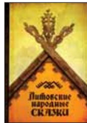
Литовские народные сказки / Сост. Б.Кербелите. М.: ФОРУМ: НЕОЛИТ, 2015. — 416 с.

5 В новом (всего лишь третьем за всю историю) сборнике литовских сказок на русском языке публикуются тексты двух архаичных жанров — сказок о животных и волшебных сказок. Во введении приведены сведения о собирании сказок, о репертуаре и особенностях литовских сказок.