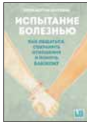
Погребин Л.К. Испытание болезнью. Как общаться, сохранить отношения и помочь близкому / Пер. с англ. И. Елифановой. М.: Livebook, 2014. — 416 с.

7 Книга посвящена одной из самых коварных ловушек человеческого общения — взаимоотношениям с близкими людьми, страдающими от тяжелых заболеваний. Чего ни в коем случае нельзя говорить и делать? Почему некоторым людям так сложно помогать? Как остаться честным с больным и с самим собой?