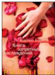
Андахази Ф. Книга запретных наслаждений / Пер. с исп. СПб.: Азбука, Азбука-Аттикус, 2014. — 256 с.

4 В новом романе латиноамериканского кудесника Федерико Андахази, как всегда, кипят страсти. Иоганн Гутенберг предстает перед судом по обвинению в убийстве книги, а неведомый безумец, вооруженный острым скальпелем, терроризирует Монастырь Почитательниц Священной Корзины — самый таинственный и роскошный дом терпимости в империи.