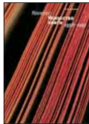
Солоненко В. Конкурс «Искусство книги». 1958–1997 М.: Арт-Волхонка, 2013. — 456 с.

6 Этот справочник — первая за всю историю проведения всесоюзного, а затем всероссийского конкурса «Искусство книги» попытка собрать воедино сведения о лучших отечественных изданиях, отмеченных наградами за достижения в области книжной графики, дизайна и полиграфии.