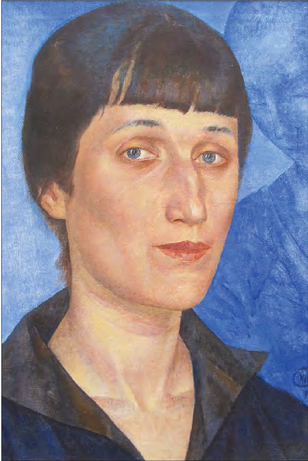
Кукла ПЕТРОВ-ВОДИН. Портрет Анны Ахматовой. 1922 год

Но суций вздор, что я живу грустя И что меня воспоминанье точит. Не часто я у памяти в гостях, Да и она всегда меня морочит. Когда спускаюсь с фонарём в подвал, Мне кажется — опять глухой обвал За мной по узкой лестнице грохочет. Чадит фонарь, вернуться не могу, А знаю, что иду туда к врагу. И я прошу как милости... Но там Темно и тихо. Мой окончен праздник!