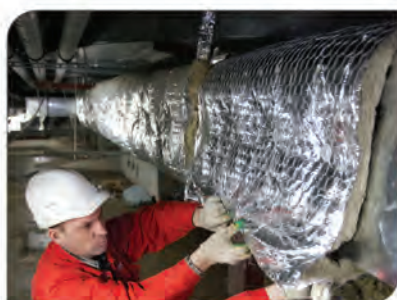
ROCKWOOL WIRED MAT 80®