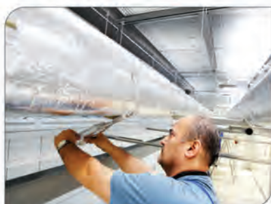
ROCKWOOL LAMELLA MAT®