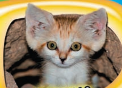
КОШКА ИЗ ПУСТЫНИ