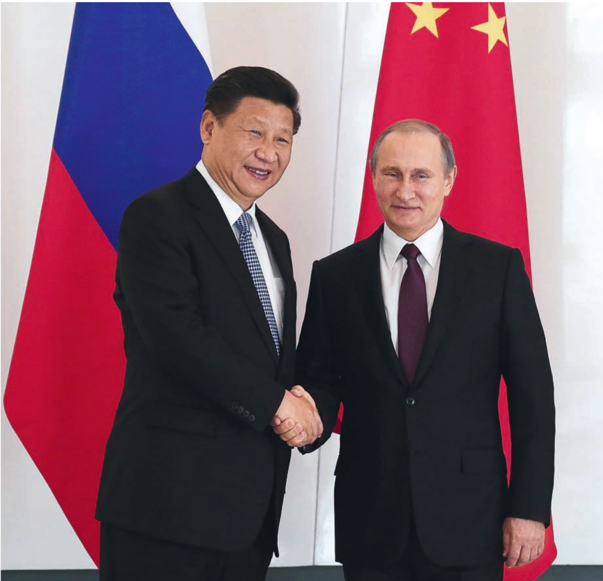
Новые договоренности, и прежде всего в экономике, должны скрепить рукопожатие двух лидеров.

«ОПЕК для чего собирается? Чтобы сократить добычу и поднять цену... Но это же не помидоры утром убрать, поэтому где-то месяца три-четыре, результат будет, увидим результат осенью. Осенью цена нефти пойдет вверх, это очевидно, нефти не будет хватать... Конечно, без сомнения она превысит $50», – поделился своим прогнозом Михаил Гуцериев.