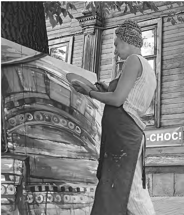
Художники приходили к дому писать картины, экскурсоводы приводили туристов.