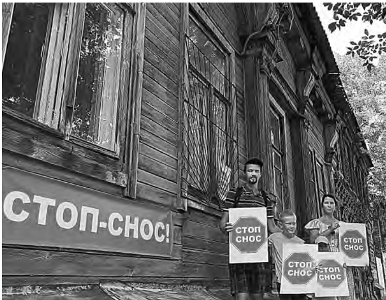
Неравнодушные горожане активно поддержали акцию общественных «Стоп-снос».

Самарцы спасли уникальную усадьбу на Садовой от сноса