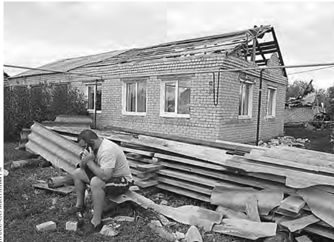
От разгула стихии в начале августа в Мордовии пострадали более 40 населенных пунктов.