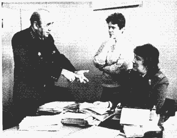
Разбор жалобы обвиняемого.

надо же, судьба распорядилась так, что посвятил следствию не один десяток лет.