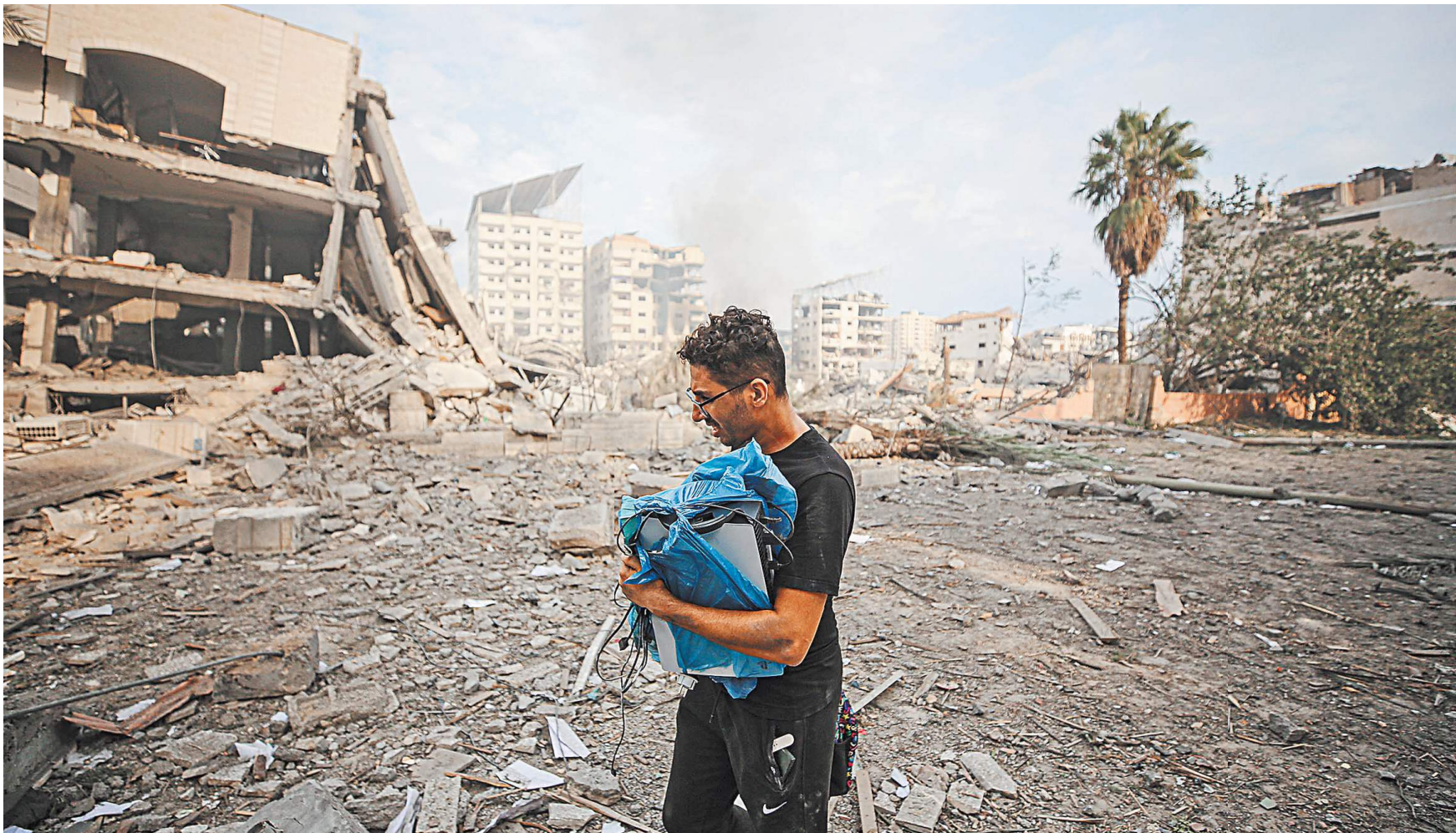
Израильские военные наносят разрушительные ракетные удары по сектору Газа (на фото) в ответ на жестокую атаку ХАМАС.

Федор Лукьянов, Профессор-исследователь НИУ «Высшая школа экономики»