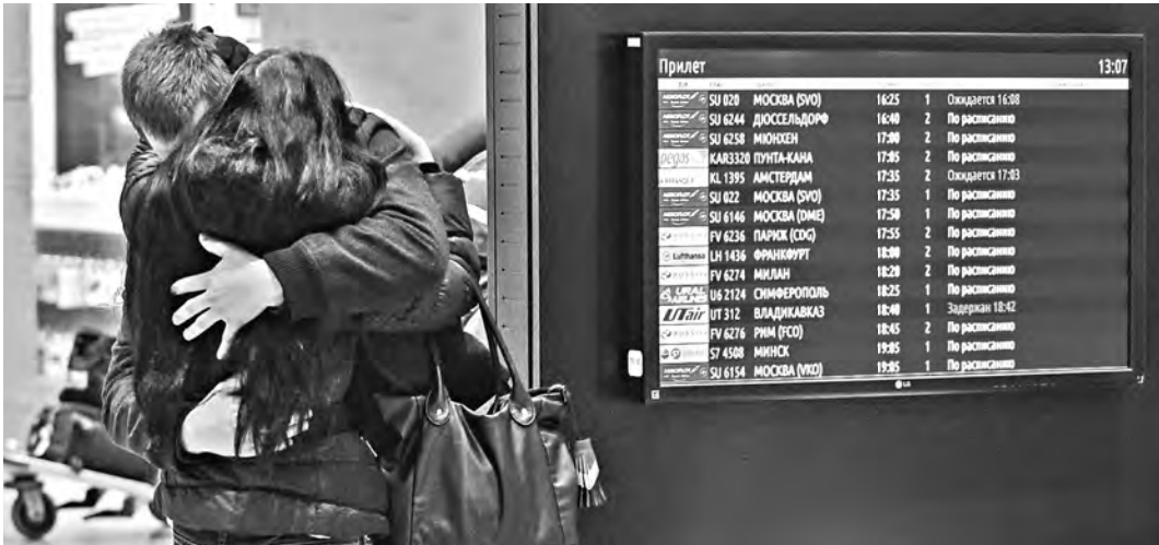
Смириться с такой потерей, пережить эту боль, кажется, невозможно...

«Задействованы для перевозки тел погибших четыре борта МЧС», — сообщил вице-губернатор города Игорь Анбин. — Технология такова, что один грузовой борт может взять порядка 80 останков».