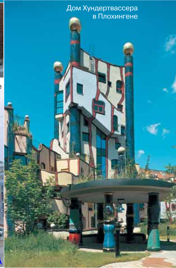
Дом Хундертвассера в Плохингене