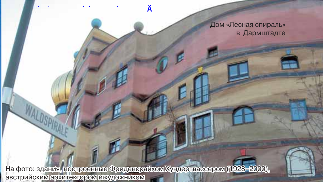
Дом «Лесная спираль» в Дармштадте

На фото: здания, построенные Фриденсрайхом Хундертвассером (1928–2000), австрийским архитектором и художником