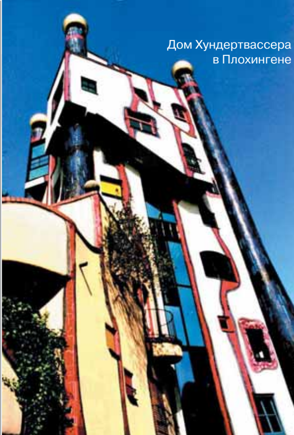
Дом Хундертвассера в Плохингене