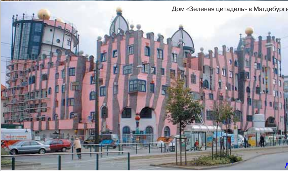
Дом «Зеленая цитадель» в Магдебурге