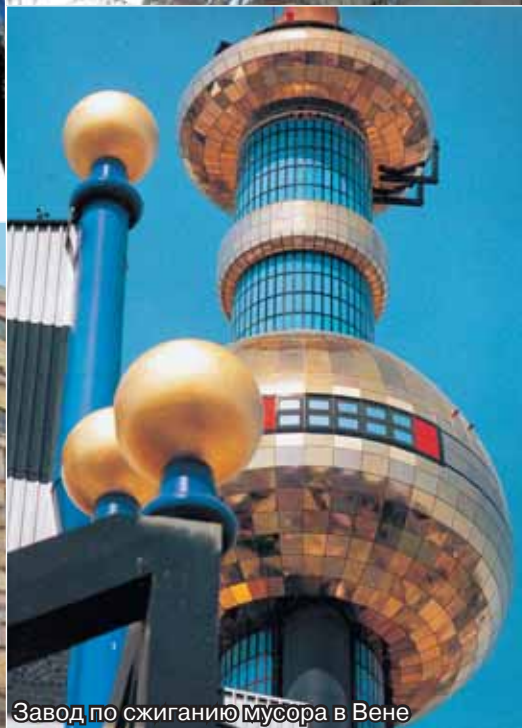
Завод по сжиганию мусора в Вене