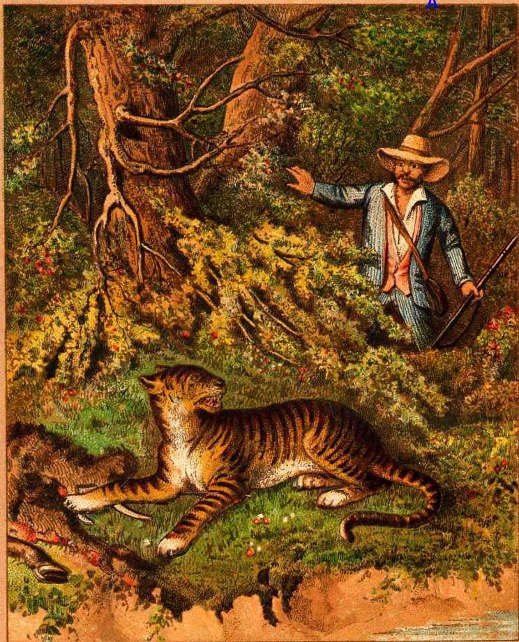
Die Tigerjagd in Ostindien.