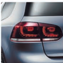
Задние светодиодные фонари