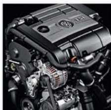
Три версии двигателя TSI