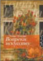
Эспедал Т. Вопреки искусству: Роман / Пер. с норв. А.Наумовой. М.: Астрель, Corpus, 2012. – 244 с.

1 Книги изобретательного норвежца Томаса Эспедала считают канон «новой дневниковой прозы». В «Вопреки искусству» он описывает, как живет и хозяйствует в ветхом домике на острове, постепенно наполняя бесхитростное повествование множеством причудливо переплетенных историй.