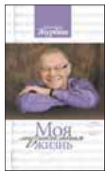
Журбин А. Моя музыкальная жизнь. М.: Зебра Е, 2012. — 512 с.

5 Композитор Александр Журбин рассказывает о своей жизни, истории создания некоторых произведений и знаменитостях, с которыми ему довелось встретиться по обе стороны океана, — Леонарде Бернстайне и Консуэло Веласкесе, Бродском, Барышникове, Оскаре Питерсоне и Фрэнке Заппа, Вуди Алене и Бобе Фоссе.