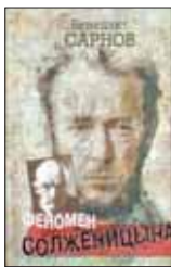
Сарнов Б. Феномен Солженицына. М.: Эксмо, 2012. — 848 с.

4 Воспевать Александра Солженицына и разоблачать его — занятия одинаково неправильные, но соблазнительные для историков и литературоведов. Бенедикт Сарнов — один из немногих исследователей, кто ставит перед собой задачу дать серьезный и, по возможности, объективный анализ как художественной, так и мировоззренческой эволюции писателя.