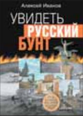
Иванов А. Увидеть русский бунт. М.: Олма Медиа Групп, 2012. – 320 с.: ил.

2 Алексей Иванов предлагает «прогуляться» по пугачевским местам, окунуться в события 1773–1775 годов, когда небольшая группа яицких казаков под предводительством некоего Емельяна Пугачева встала во главе знаменитого крестьянского восстания, — и убедиться в том, что Пушкин был все-таки не прав: русский бунт отнюдь не так бессмыслен, как мы привыкли думать.