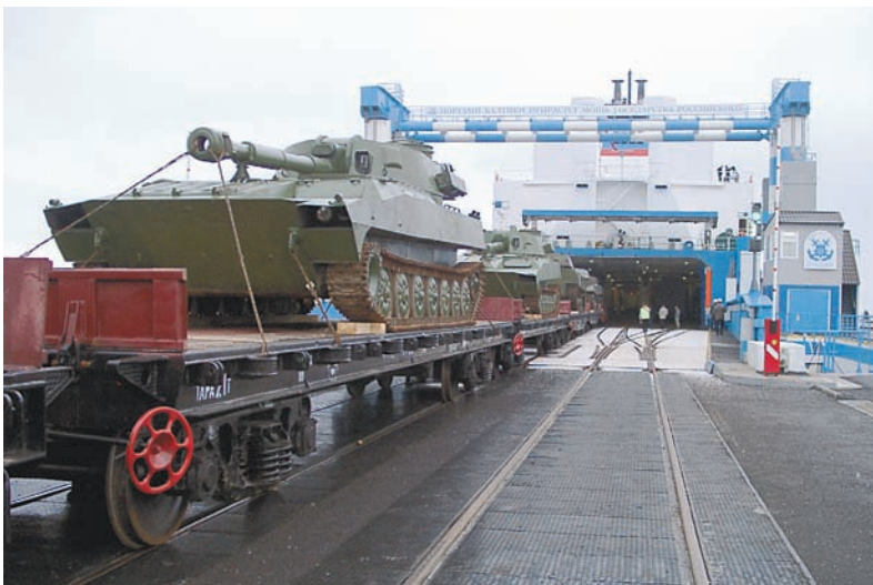
Погрузка техники на паром «Амбал».

Владимир ДАШЕВСКИЙ, фото автора и из архива службы.