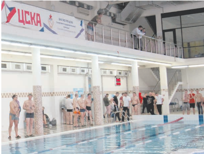
На спартакиаде Балтийского флота по плаванию.

На территории спортивно-оздоровительного комплекса функционирует аквапарк с плавательным бассейном, оснащённый по самым современным стандартам, которому нет равных в регионе по масштабу и количеству водных аттракционов.