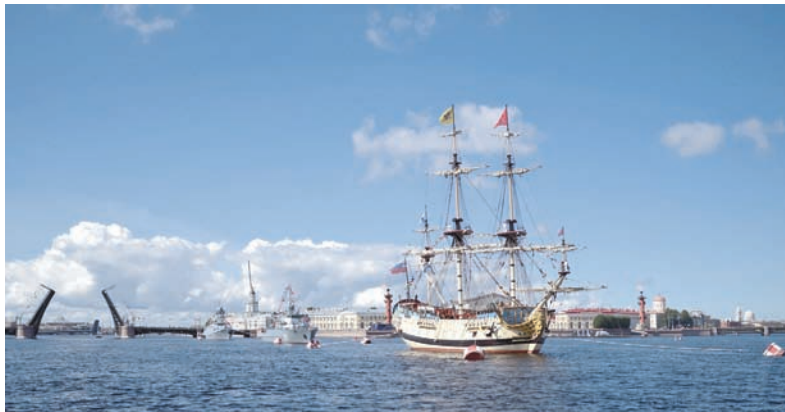
Во главе парадной линии – исторический 54-пушечный линейный корабль «Полтава».

Перед парадом Президент России Владимир Путин вместе с министром обороны генералом армии Сергеем Шойгу, главкомандующим ВМФ адмиралом Николаем Евменовым и командующим войсками Западного военного округа генерал-полковником Александром Журавлёвым на белоснежном катере «Рактор» обошли парадную линию боевых кораблей в акватории Финского залива и на Кронштадтском рейде.