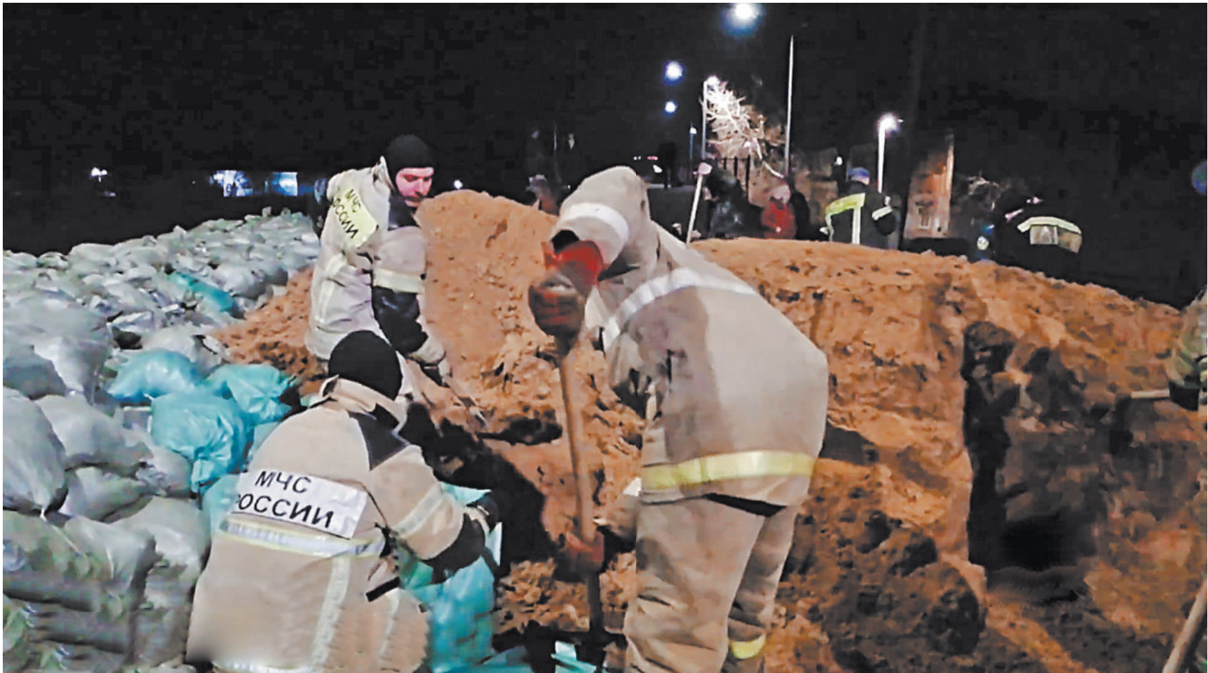
МЧС России по Курганской области

В Кургане и Оренбурге со вчерашнего утра звучат сирены: власти призывают срочно эвакуироваться всех, кто проживает в зоне возможного затопления. Мощный, небывалый паводок, вслед за Орском, вплотную подступает и к областным городам. Курганская область третий день живет в режиме ЧС. Развитие паводка здесь идет по наихудшему сценарию. 9 апреля река Тобол в районе приграничного села Звериноголовское вышла на пойму, уровень воды стремительно растет и преодолел уже 8 метров. Неблагоприятные явления здесь наступают при отметке в 850 сантиметров, а опаснее — при 1060. Если дело так дальше пойдет, то через день, а то и раньше, большая вода будет уже в областном центре. По прогнозам, уровень Тобола в Кургане может превысить