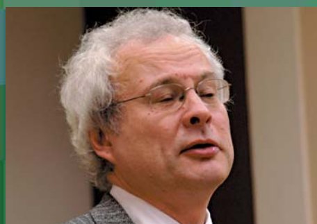
В.М. Захаров, член Общественного совета при Президенте РФ