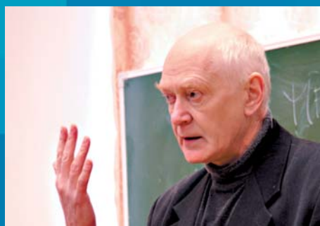
Г.А. Заварзин, академик