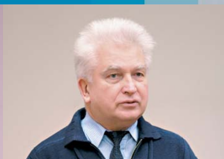
Ю.Г. Евтушенко, директор ВЦ РАН