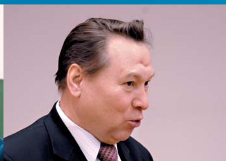
А.Ф. Порядин, профессор, заслуженный эколог РФ