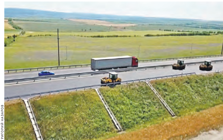
На участке «Тавриды» от Белогорска до Симферополя началась укладка верхнего слоя асфальтобетона.