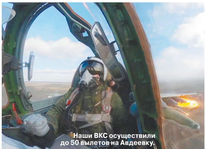
Наши ВКС осуществили до 50 вылетов на Авдеевку.