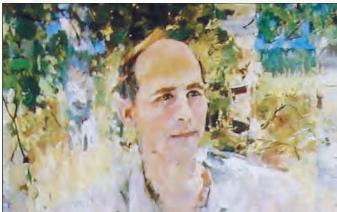
Худож. Н. Баскаков. 1988

Россия, Русь — куда я ни взгляну! За все твои страдания и битвы Люблю твою, Россия, старину, Твои леса, погосты и молитвы, Люблю твои избушки и цветы, И небеса, горящие от зноя, И шёпот из у омутной воды, Люблю навек, до вечного покоя... Россия, Русь! Храни себя, храни!