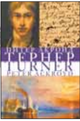
Акرويد П. Тернер / Пер. с англ. З.Меленевской. М.: Колibri, Азбука-Аттикус, 2012. – 224 с.

1 Эта книга — жизнеописание великого английского живописца, во многом опередившего свое время. Блестящий биограф Питер Акرويد, автор книг о Ньютоне, Шекспире и Чосере, создает живой и убедительный образ человека, посвятившего всю свою жизнь искусству и оставившего нам прекрасные полотна, на которых свет и цвет явлены в единстве и постоянном движении.