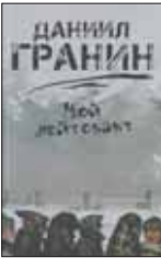
Гранин Д. Мой лейтенант. М.: ОЛМА Медиа Групп, 2012. – 320 с.

2 Новый роман Даниила Гранина — это взгляд на Великую Отечественную с изнанки, не с точки зрения генералов и маршалов, спокойно отправлявших в пекло целые армии, а изнутри, из траншей и окопов. На фоне тягот, ужасов и неприглядности войны автор дает возможность выговориться простому лейтенанту, одному из тех, кому мы обязаны своей победой.