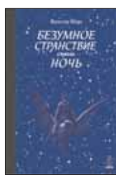
Мёрс В. Безумное странствие сквозь ночь / Пер. с нем. З.Венгеровой. М.: Zangavar, 2012. — 96 с.

6 Автор книги Вальтер Мёрс — современный немецкий писатель и создатель комиксов. Многие его произведения, в частности цикл романов, повествующих о волшебном мире Замонии, стали бестселлерами. Впервые переведенная на русский язык книга «Безумное странствие сквозь ночь» — дань уважения художественному гению Гюстава Доре.