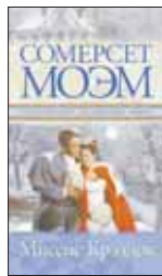
Моэм С. Миссис Крэддок / Пер. с англ. Н.Сечкиной. М.: АСТ, Астрель, Полиграфиздат, 2011. — 381 с.

7 Жизнь миссис Крэддок — история незаурядной женщины с богатым воображением. Ее избранники — добрый, но грубоватый мистер Крэддок и порочный, избалованный юноша Джеральд — не смогли оценить силу и глубину личности Берты. Внутренний бунт героини заранее обречен на поражение. Но проигрывая она собирается достойно.