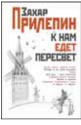
Прилепин З. К нам едет Пересвет. Отчет за нулевые. М.: Астрель, 2012. – 445 с.

3 Захар Прилепин — один из самых модных отечественных молодых прозаиков, лауреат литературных премий, среди которых «Национальный бестселлер», «Супернабест» и «Ясная Поляна». В книге «К нам едет Пересвет» собраны лучшие эссе Захара — как хорошо известные читателю по журналам и Интернету, так и не публиковавшиеся ранее.