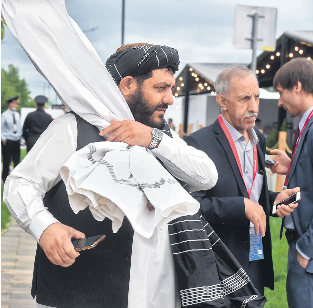
Некоторые участники форума уже вызвали ажиотаж в прессе. Прежде всего, это небольшая делегация движения «Талибан», захватившего власть в Афганистане в прошлом году. В России оно официально считается террористическим и запрещено

Юбилейный ПМЭФ этот расклад наглядно подтверждает. В Санкт-Петербурге приехали высокопоставленные официальные представители из более чем 40 государств. Посольства 80 стран прислали своих дипломатов. В основном это как раз государства Ближнего Востока и Африки, Азии, Латинской Америки. Главная страна—гость форума в этом году — Египет. Представительные делегации зарегистрировались и от стран постсоветского пространства, входящих в курируемые Москвой интеграционные структуры — ЕАЭС, ОДКБ и СНГ. Бизнес-делегации также в основном представлены упомянутыми регионами.