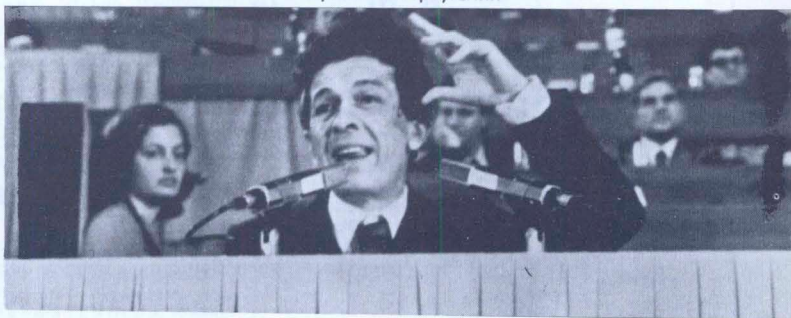
Берлингуэр в Италии