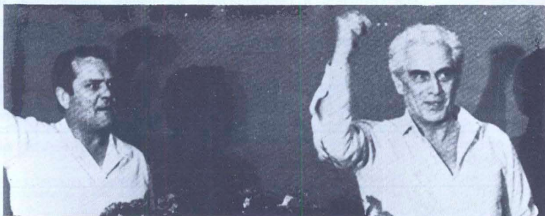
Куньял в Португалии

ЕЖЕМЕСЯЧНЫЙ ОБЩЕСТВЕННО - ПОЛИТИЧЕСКИЙ ЖУРНАЛ