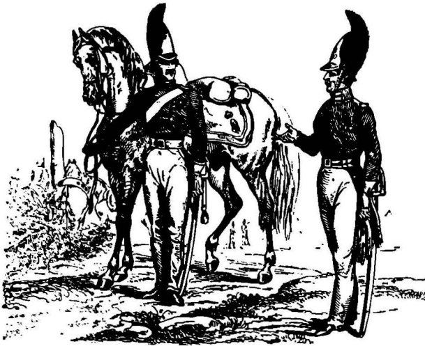
Драгуны русской императорской гвардии. С грав. XIX в.