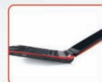
Тончайший корпус в линейке Qosmio