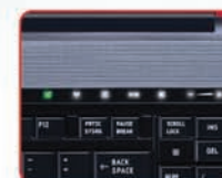
Панель управления EasyControl