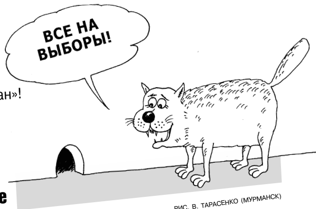
РИС. В. ТАРАСЕНКО (МУРМАНСК)