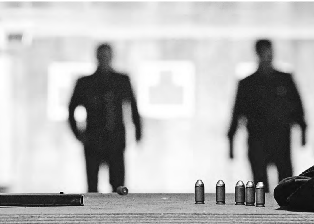
Коллекторы объясняют интерес к оружию должников тем, что это ценное имущество. Аргумент сомнительный.