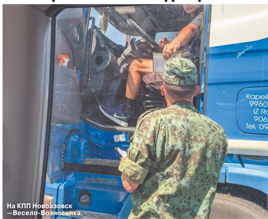
На КПП Новоазовск — Весело-Вознесенка.

Спецкор «МК» добралась до полуострова, проехав по новым территориям