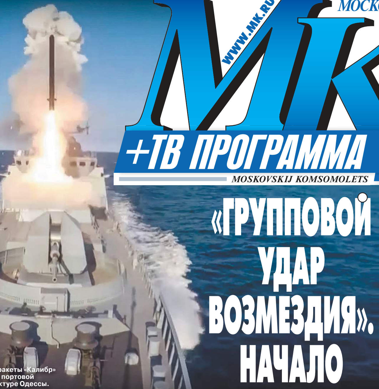
Крылатые ракеты «Калибр» ударили по портовой инфраструктуре Одессы.

Не менее странного персонажа женского пола разыскивают правоохранители на северо-западе Москвы. Здесь настоятеля и прихожан церкви Священного мученика Ермогена, что на улице Фабричного, буквально затерроризировала странная особа. Сначала она попыталась пройти в храм с велосипедом. Ей, разумеется, отказали. Через несколько дней женщина явилась в церковь с белым голубем на плече. Ей пояснили, что проносить птицу в церковь нельзя. На этот раз женщина заявила: «С раз женщина заявила: «С мужем, котом нельзя, с велосипедом нельзя, тогда я приду с демоном». В итоге посетительница все же прошла в храм с голубем, взяла бесплотную свечу для молитвы, подожгла аналой и икону, после чего быстро удалилась. Возгорание удалось ликвидировать своими силами, но храму был причинен ущерб на сумму 55 тысяч рублей. Пока неясно, какие цели преследовала явно нездоровая поджигательница.