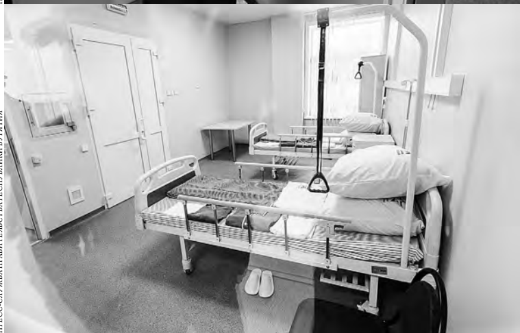
ПРЕСС-СЛУЖБА ВОЕННО-ТОХОКЕАНСКОМУ ФЛОТУ