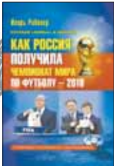
Рабинер И. Как Россия получила чемпионат мира по футболу-2018: Спортивно-политическое расследование. М.: Астрель, 2012. – 480 с.

1 Когда из Цюриха пришла добрая весть о том, что именно мы примем у себя мировой чемпионат по футболу, все так обрадовались, что впали в счастливое забытие. Человеком, приоткрывающим завесу тайны с закулисных интриг этой победы, стал обозреватель газеты «Спорт-Экспресс» и автор многочисленных спортивных бестселлеров Игорь Рабинер.