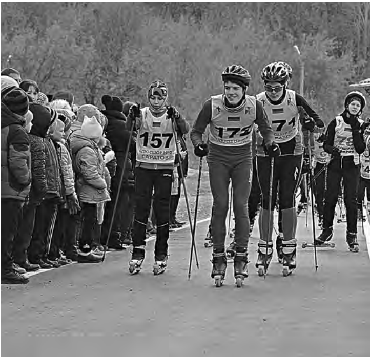
ПРЕСС-СЛУЖБА ГУБЕРНАТОРА САРАТОВСКОЙ ОБЛАСТИ

рального и областного бюджетов. Всего вложили 80 миллионов рублей. – Я отслеживала все этапы строительства начиная с проекта. Сделана отличная лыжероллерная трасса, которая станет базой для подготовки биатлонистов, лыжников, велосипедистов. Строительство планируется продолжить, в рамках второй очереди построят гостиницу и столовую для спортсменов, – рассказала олимпийская чемпионка. Как сообщили в правительстве области, спортивный объект передадут в оперативное управление специализированной детско-юношеской спортивной школе олимпийского резерва № 3 Саратова. Губернатор Валерий Радаев подарил учебному заведению сертификат на 100 пар лыж и два снегохода. Андрей Куликов, Саратов