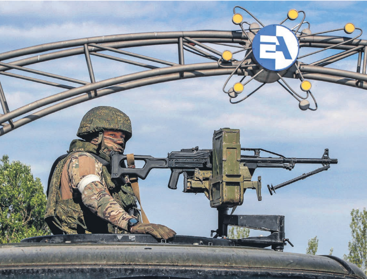
В Москве предупреждают, что ситуация вокруг Запорожской АЭС, которую охраняют около 500 российских военнослужащих, с каждым днем становится все более опасной

По словам начальника Национального центра управления обороной РФ Михаила Мизинцева, обстрелы территории Запорожской АЭС украинскими вооруженными формированиями носят «намеренный и регулярный характер», из-за чего создается «реальная угроза ядерной безопасности не только Украины, но и Европы». «В случае аварии на Запорожской АЭС произойдет глобальная техногенная катастрофа, которая по масштабам радиоактивного загрязнения значительно превысит последствия аварий на АЭС в Чернобыле и Фукусиме», — предупредил он на брифинге в Москве.