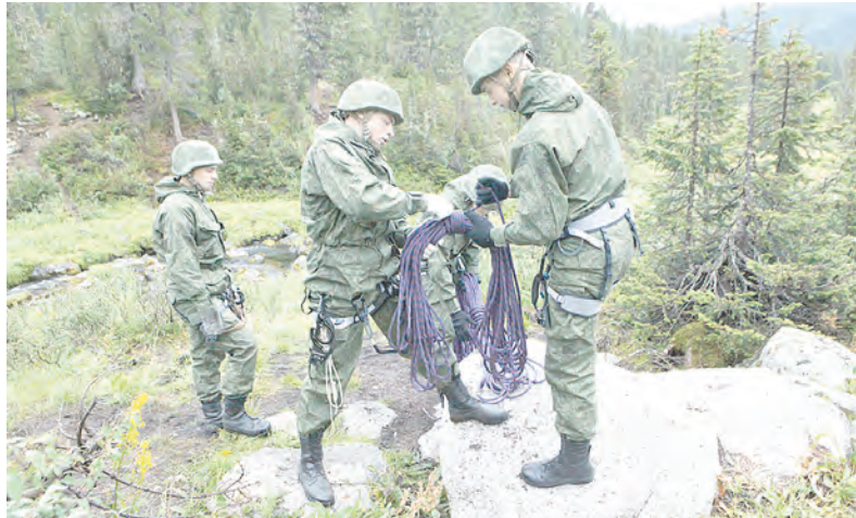
По сообщениям пресс-службы ЦВО подготовил Андрей ЯМШАНОВ.

В соревнованиях приняли участие более 100 человек. Лучшие военнослужащие и сборная команда продолжают состязания на всероссийском этапе «Эльбрусского кольца».